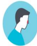
PÉRDIDA DEL SENTIDO DEL OLFATO